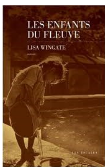
Les enfants du fleuve Lisa Wingate

Memphis, 1939. La famille Foss vit sur une péniche au bord du fleuve Mississippi où les conditions de vie précaires sont compensées par l'amour qui unit les parents et les cinq enfants. Un jour, alors que les plus jeunes sont laissés sous la surveillance de l'aînée, la police investit la péniche et emmène tout le groupe vers un orphelinat. Les cinq frères et sœurs réalisent bien vite qu'ils ne reverront jamais leurs parents ; la mystérieuse Société des foyers d'accueil du Tennessee vient de sceller leur sort.